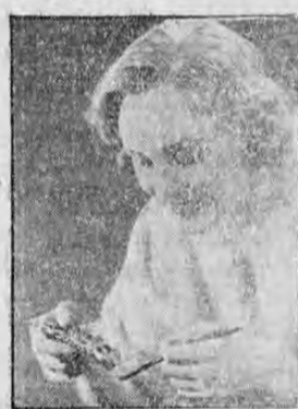
sus dientes con Ipana y masaje