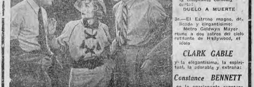
Clark Gable y Constance Bennett en "After Office Hours"

Aquí está en la pantalla otra vez el idolo de las mujeres, más apasionado, más romántico, más atrayente que nunca! Suntuoso programa de estreno para celebrar el DIA FERIADO DEL CORPUS CHRISTI!