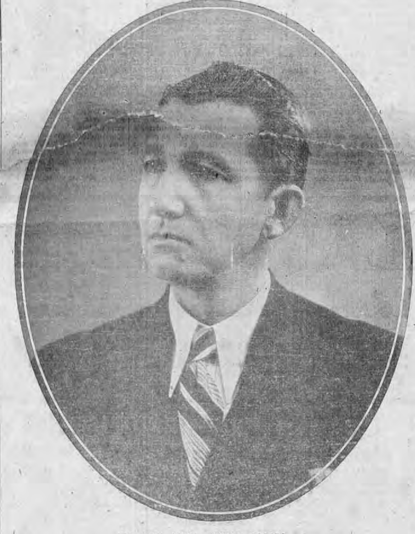
LIC. DON LEON CORTES CASTRO