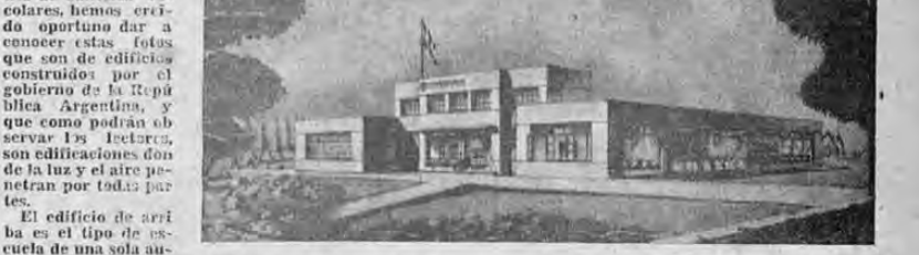
La y el de abajo, el del Upo de una escuela de cuatro a seis aulas.