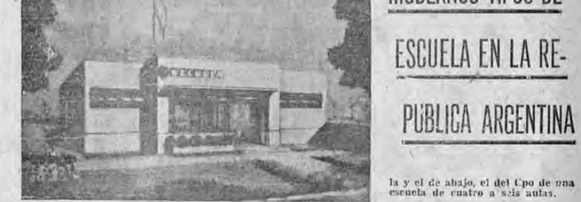
La y el de abajo, el del Upo de una escuela de cuatro a seis aulas.