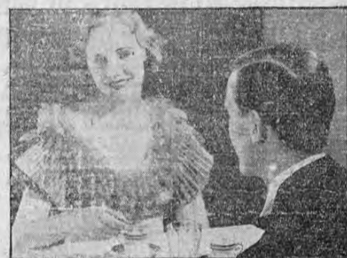
Deléite su paladar con ricos manjares—luego proteja...

disfrutaba de general estimación entre sus relaciones. La triste desaparición del recordado extinto ha producido intensa pena. LA TRIBUNA expresa su condolencia muy sentida a la apreciable familia doliente.