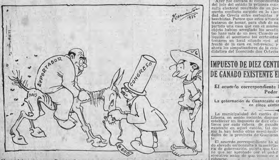
Vean viejos, no se confíen mucho porque a veces corcovea y puede salir alguno dañado!

Con el informe recibido en seguridad pública de que la expedición tardará más de tres meses, se han enviado, además de las provisiones necesarias para el mantenimiento de la fuerza y además gasolina suficiente para la planta generadora de energía eléctrica que allí se ha establecido.